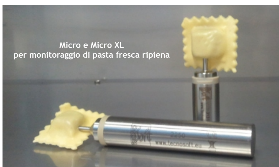
Micro e Micro XL per monitoraggio di pasta fresca ripiena