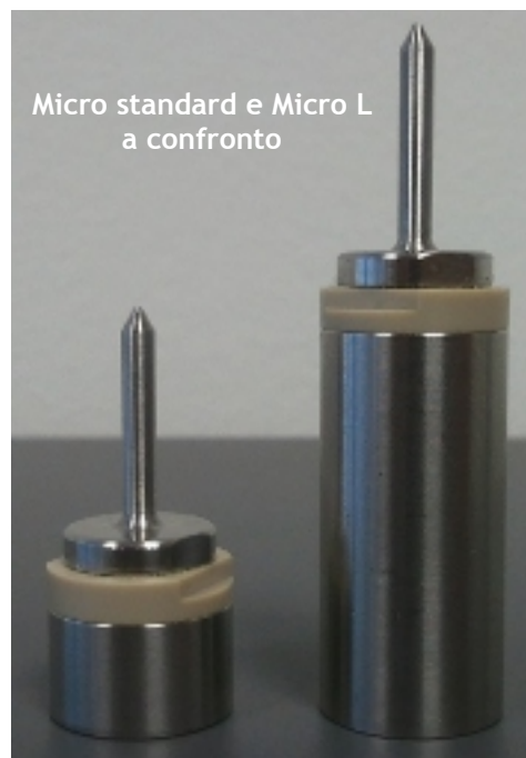
Micro standard e Micro L a confronto

Tutti i data logger funzionano con la DiskInterface HS. Per la versione standard è disponibile anche la DiskInterface HS. Il software SPD è incluso con le interfacce.