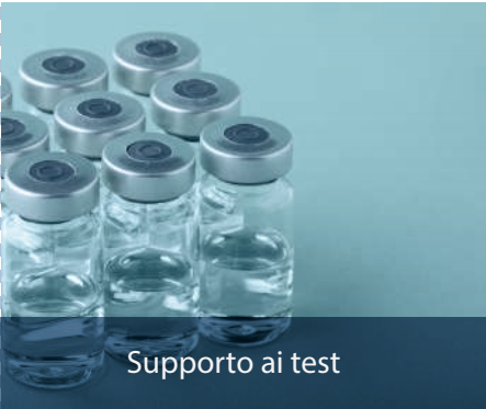
Supporto ai test